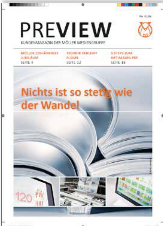
Ansicht ohne korrigierte Voreinstellungen

Was im ersten Moment banal erscheint, stellt mitunter eine Herausforderung dar, wenn man sich korrekt verständigen bzw. korrekte Ergebnisse sehen will. Grundsätzlich sollten zur Betrachtung immer die Adobe-Produkte (Acrobat Reader oder die Acrobat-Vollversion) benutzt werden. Jegliche Ansicht von PDF's in Browsern oder Hilfsprogrammen (auch die Vorschau von MacOS) kann zu Fehlern führen. Wichtig vor Betrachtung der PDF ist eine Korrektur der Acrobat-Voreinstellungen. Wir konzentrieren uns hierbei auf die Einstellungen in der Kategorie "Seitenanzeige", da hier die für uns wichtigsten Korrekturen vorgenommen werden müssen. In unserem Beispiel vergleichen wir eine Seite vor und nach der Korrektur der Voreinstellungen.