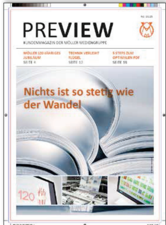
Ansicht mit korrigierten Voreinstellungen